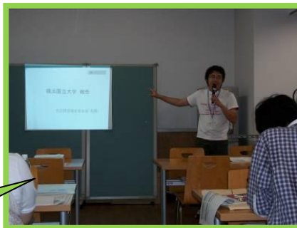
大学報告の様子です。

その後は、全員で2011年度の読書推進活動の新学期総括について資料を用いて確認し、 2011年度の成果と課題点を確認しました。