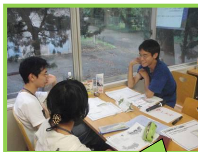
大学別の時間の様子です。

執筆担当：川崎大志（リーダーズネットワーク副代表） 協力：東京事業連合第1事業部書籍商品課